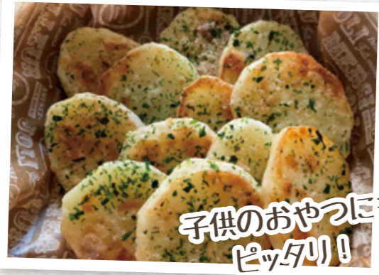
子供のおやつにも ピッタリ!

(1人当たり) エネルギー:266kcal/たんぱく質:2.7g/ 脂質:12.2g/塩分:0.8g